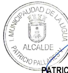
PATRICIO PALLARES VALENZUELA ALCALDE

DISTRIBUCION: -ADQUISICIONES DESAM -ARCHIVO DESAM -PPV/MIIG/VAC/Insp