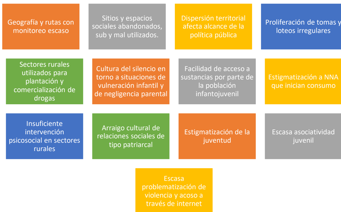
Ilustración 2. Factores de riesgo detectados en materia de seguridad