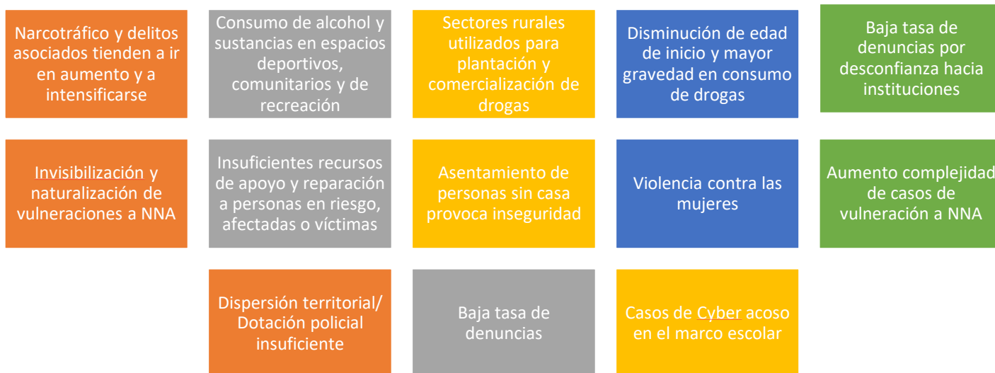
Ilustración 1. Factores críticos detectados en materia de seguridad